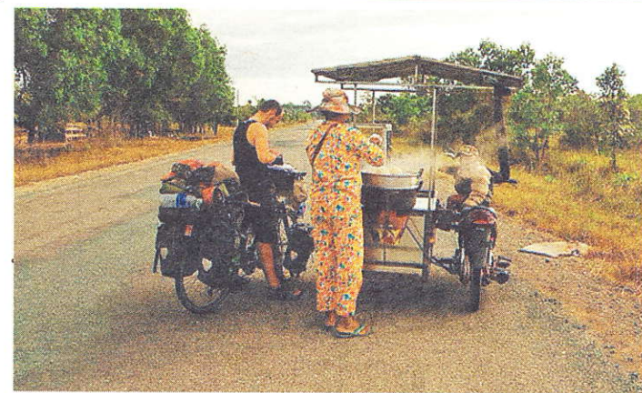
Des étals le long des routes: pratique.

ponse. Mais, voyager, ce n'est pas uniquement «avalé» des kilomètres ou ajouter un pays à sa liste. Voyager, c'est aussi et surtout partager avec les gens, recueillir quelques témoignages, se faire son propre avis et donner son opinion.