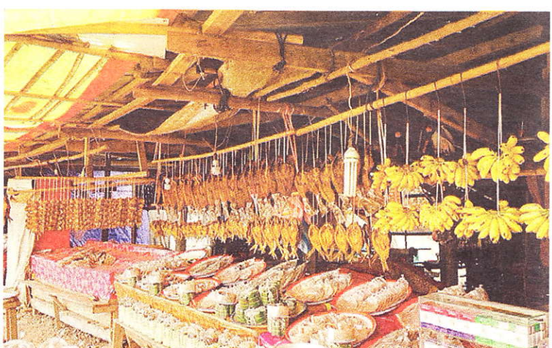
Ravitaillement indispensable avant les cols.