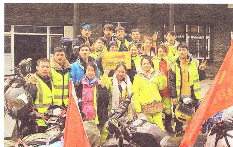
Direction Lhassa pour ces jeunes Chinois.