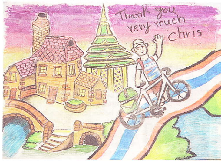
Un petit dessin de Chris adressé aux lecteurs.