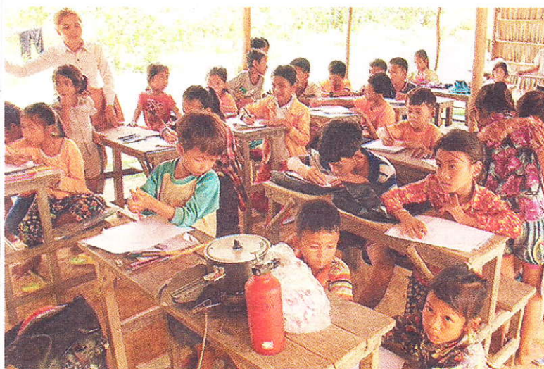
En haut, les enfants... toujours aussi curieux de tout. Ci-dessus, dans la campagne cambodgienne: animation par une ONG.

d'être ici. Quand je plante ma tente dans un champ, au milieu du bétail, j'ai le sourire aux lèvres».