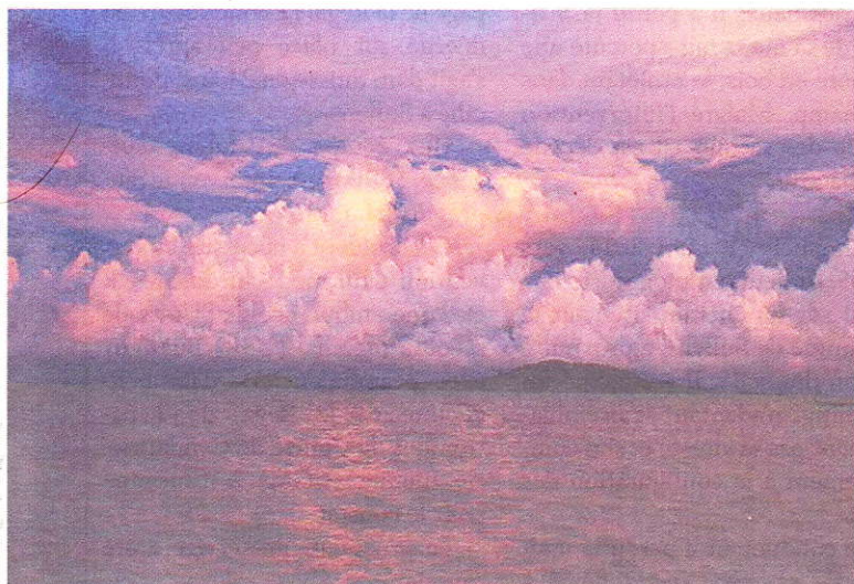
Un coucher de soleil «incroyable».

Au terme de ses messages, Chris conclut par des «merci» divers et nombreux dédiés à cette Asie du Sud-Est où il compte bien revenir ... une fois. Merci au Cambodge, fidèle à lui-même. Sourires, pouces levés, rires, ce pays prend son temps et avance à son